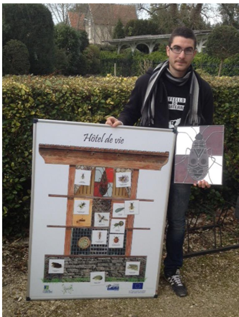
Photo : Outil pédagogique accompagnant l'hôtel à insectes

L'animation consiste à découvrir avec les enfants (ou le public concerné) cet hôtel et l'ensemble des abris qui le composent. Cette animation se déroule sous la responsabilité d'un animateur de l'association avec un groupe d'environ 10 personnes.