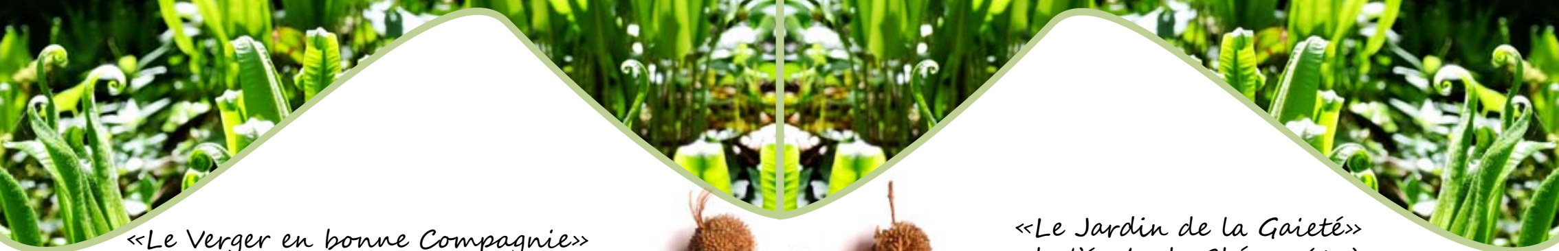
«Le Verger en bonne Compagnie» du RPI de Challignac